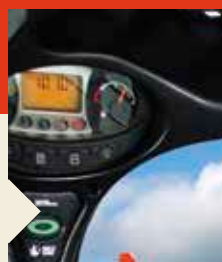
Tableau de bord gauche (standard)