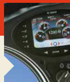
Tableau de bord droit Deluxe (option)