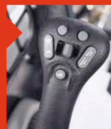
Commandes aux manipulateurs commutables (SJC)