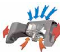
Système de refroidissement